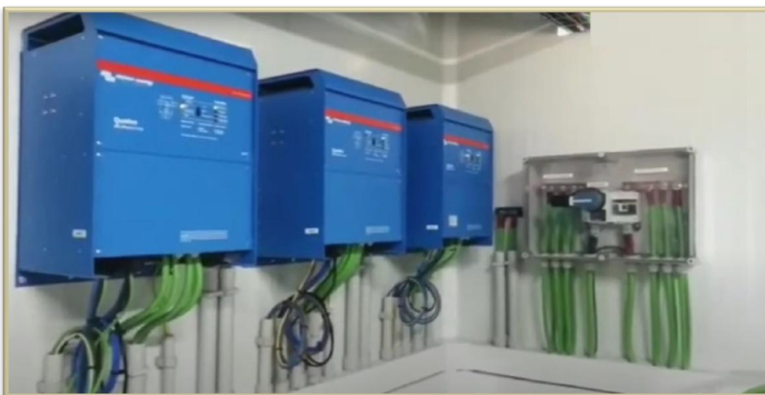
Image 3: Inverters and voltage and voltage regulators